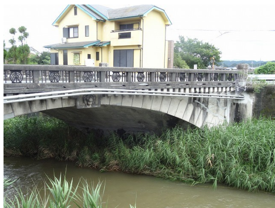
20.御所の街中に珍しいコンクリートアーチ橋が 21.アーチクラウンにはライオンの頭が

これまで雨も降らずに傘がかさばっていたが、ポツポツと雨が落ちて来た。終わりに近づいたところまでよく我慢してくれて有難う！