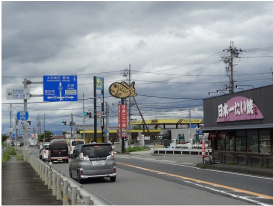
16.この店、岡山の旭川遡行時に会ったぞ！