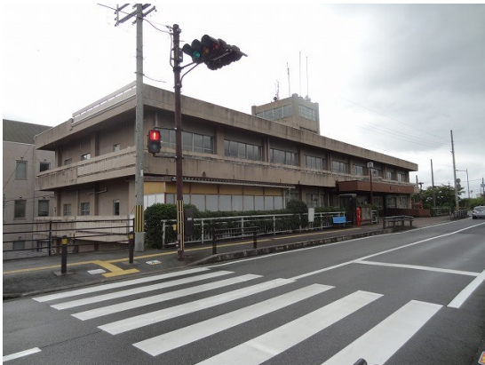
24.市役所前の橋を見て駅に向かう

直ぐに市役所手前の最後の橋に着く。名前は「学び橋」。市役所の向かいに御所小が更に北には御所中が有る。なるほどガテンガテン。