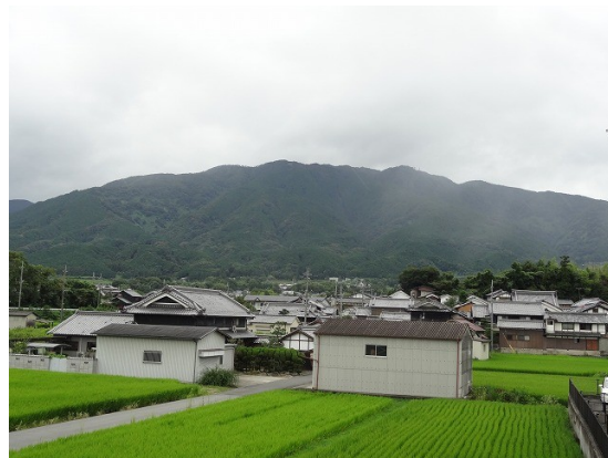
18.葛城山が真横に見える所までやって来た

最近右足の踵の後ろ側が歩いて足を浮かすときに痛みが走るようになってきた。そのため快調とはいかないが気分よく歩き、葛城山が真横に見えるようになる。