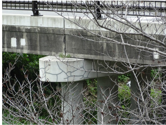
15.橋脚のクラックを上手くカモフラージュしているぞ

御所市道の「西寺田橋」を見ると橋脚と橋台のコンクリートに模様が入っている。表面に出たクラックを補修し、いかにも元から在る模様に見せかけているぞ。橋脚は杭基礎の杭をそのまま立ち上げこれを横梁で繋ぎその上に桁を載せている。見た眼にはこの梁が杭の太さと較べ断面が小さい。