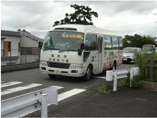
22.御所市コミバス「ひまわり」が通過