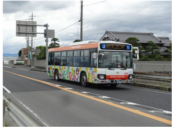
17.最長路線の新宮行き奈良交通バスが南に向かって行くぞ

最近右足の踵の後ろ側が歩いて足を浮かすときに痛みが走るようになってきた。そのため快調とはいかないが気分よく歩き、葛城山が真横に見えるようになる。