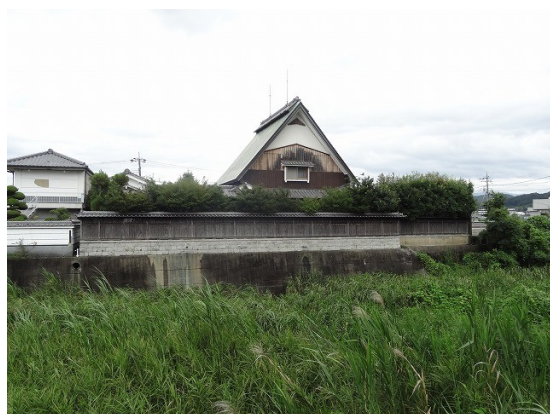
19.広い屋敷に変わった屋根が突き出てるぞ

平地の街中には珍しいコンクリートアーチ橋が川を跨いでいる。親柱に彫られた橋名は判読できないが、直ぐ近くの本停名は「端駟橋」とある。完成時期は指でなぞると昭和3年のようだ。90歳の橋が現役で頑張っている。所々に補修の後が有るがまだまだいけるぞ。アーチ橋は両側がしっかりとしていれば何年でも持つぞ。