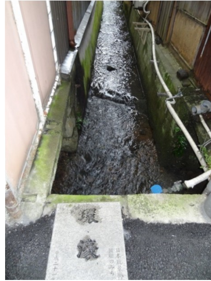
25.大きな酒屋で奈良の酒をお買い上げ 26.御所が環濠集落だった証がここに

和歌山線の踏切を進むと北の御所駅 2 番線に奈良行き電車が停車している。1 時間に 1 本の貴重なシーンである。今日も近鉄で帰るのでそのまま近鉄御所駅に向かう。今どき珍しい硬券の入場券が有るのを知り購入する。