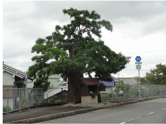
23.樹の上部が無くなっている古木だが丈夫だな

直ぐに市役所手前の最後の橋に着く。名前は「学び橋」。市役所の向かいに御所小が更に北には御所中が有る。なるほどガテンガテン。